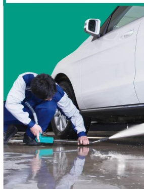
⑦ ホイールクリーニング