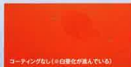
コーティングなし(※白化が進んでいる)