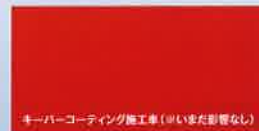
キーパーコーティング施工車(※いまだ影響なし)